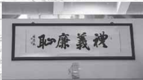
圖書館內的書法作品

在每層樓的牆壁上，隔一段距離就掛了一幅畫作，果然是匯集了人文薈萃的地方！這裡的空間之大，遠超出我想像，也不知是不是我方向感過於差勁，一排排的書架彷彿迷宮，我差點就迷失了方向！可見這裡的藏書之多啊！我找到喜歡的書後，便席地而坐，埋頭就進入書中世界，全然沒想到時間悄悄溜走了。直到口袋裏不斷的震動，才提醒我集合時間到了。我依依不捨的離開圖書館，經過了幾個青色沙發，我才發現自由活動半個小時，我竟沒好好在沙發懷抱中享受他它的舒適，畢竟圖書館除了有讀書氛圍，懷有悠閒的情致也是很重要的。