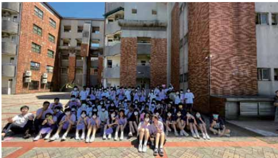
人文社與其他社團的聯合迎新

今年，為了深入研究作為熱門社團之一的人文社，有幸邀請了人文社的社長和副社長，中午在圖書館會面，現場分享她們在人文社的心路歷程。