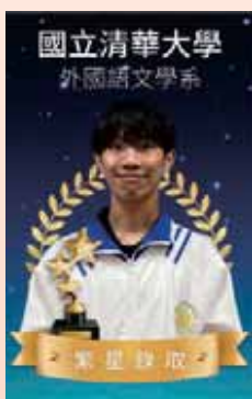
國立清華大學 外國語文學系 601 蔡威廉

我是連偲羽，國中會考完以 5A 成績放棄選擇明星高中，反而由永豐高中國中部直升，進入永豐第一屆雙語實驗班。高中三年努力維持在校成績第一名，希望利用繁星的機會考上理想大學。繁星必須要維持各學科的優異表現，我付出了許多時間兢兢業業的努力。在雙語實驗班這三年內，參加國際交流，多元探索自己的興趣所在，我發現自己對法律系有許多熱忱與嚮往，因此定下我的目標。父母對我的選擇也都持開放態度，全力支持我的抉擇。老師與學校在這三年內也給予我許多資源與幫助，在我有疑問時清晰地解答，使我不再迷茫，感謝大家的幫助，鼓勵與支持我才能安穩順利地完成夢想，如願考上台大法律系。