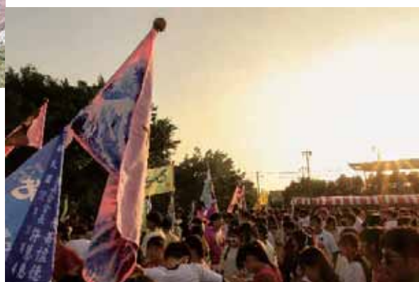
右圖——602 謝睿恩 | 散場之後