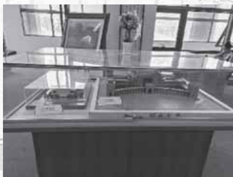
開南大學的學校模型

在這趟短暫的旅途我不僅從主任和教授學到的了豐富的理財觀與一雙讀得懂財經的眼睛，還懂得趁早好好規劃自己的人生多去看看不一樣的世界體驗不一樣的生活，跟見識到了許多我從沒看過的書。