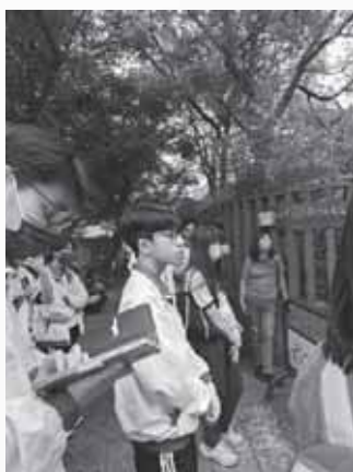
參訪心得專注的組員

參訪鍾肇政文學生活園區對我來說除了讓我更加地了解對鄉土文學以及鍾肇政筆下的台灣，也讓我對台灣的歷史與文化有了更深的認識。