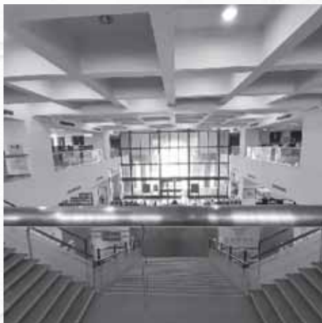
圖書館二樓的俯視圖

總而言之，開南大學圖書館的參觀讓我深刻感受到這個學術殿堂的獨特之處。無論是寧靜的閱讀環境還是豐富的資源，都讓我對這座圖書館印象深刻。期待未來有機會能夠再次踏足這片知識的海洋，繼續尋找屬於我的學術之光。