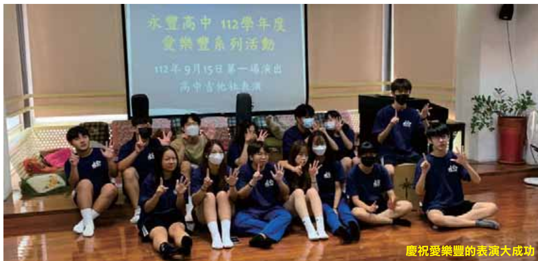
慶祝愛樂豐的表演大成功

總而言之，吉他社是一個讓音樂愛好者盡情發揮熱情、學習、成長和展現自己的理想場所。無論你的音樂水平如何，只要你對音樂充滿熱情，你就能在這個社團中找到自己的位置。吉他社不僅教會了我們彈奏吉他，還教會了我們關於團隊合作、堅持不懈和享受音樂的重要性。讓我們珍惜每一刻，保持初心，一起享受這個充實的音樂之旅。無論你是新手還是老手，只要你愛音樂，吉他社總是為你敞開大門，等待你的加入，因為音樂的旅程，才剛剛開始。