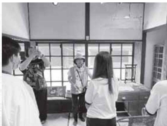
鍾老的學生擔任導覽