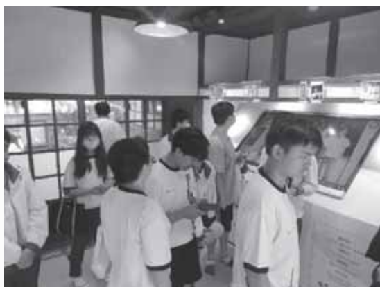
實地觀察鍾老生活與創作場域