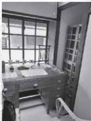
鍾肇政先生的書桌， 很多經典的文學作品 都是在這裡完成