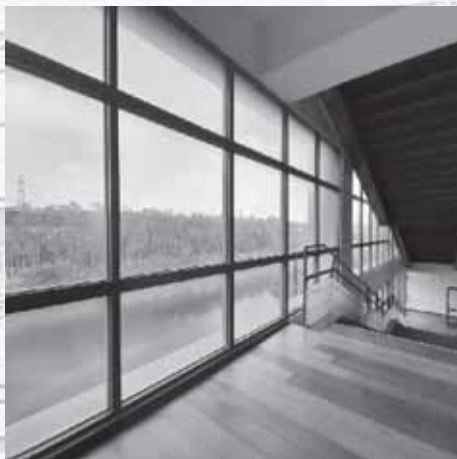
圖書館樓梯間的景色