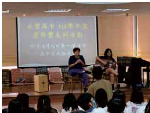
吉他社愛樂豐表演

他們認為吉他是一種好上手又適合多種場合演奏的樂器。無論是彈奏悠揚的旋律還是奏出動感的和弦，吉他都能在不同場合中展現其多樣性。在吉他社中，我們學到了如何彈奏不同風格的音樂，並將這種多樣性轉化為我們音樂的一部分。這種靈活性讓我們能夠參與各種表演和演出，無論是在校園內還是在市集活動中，我們都能展現吉他的魅力。