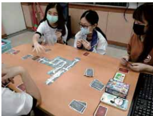
桌遊社員們玩樂時的照片

總結來說，這次的採訪桌遊社的經歷讓我們更加欣賞桌遊的魅力，也讓我深信，遊戲不僅僅是娛樂，更是一種聯繫人們情感和培養智慧的方式。只要有熱情和共鳴，無論是什麼年齡，都能找到屬於自己的樂趣。