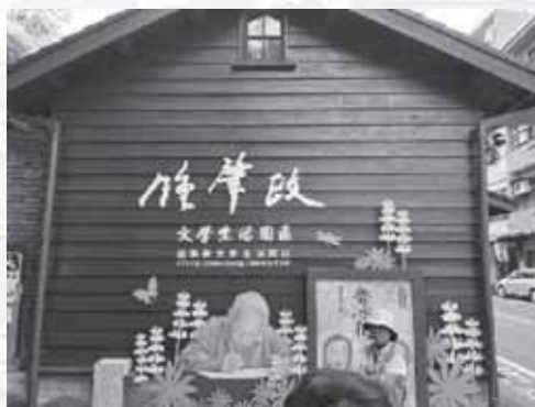
鍾肇政文學生活園區一隅