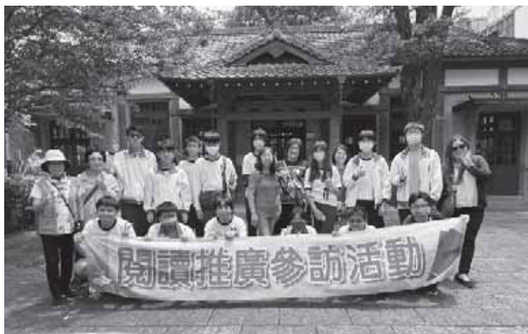
日治古蹟武德殿留念