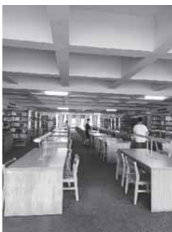
開南大學的圖書館