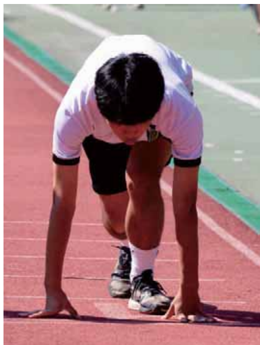
112年運動會攝影比賽入選作品