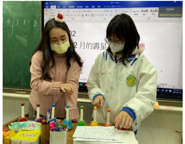
用搖鈴譜出聖誕組曲