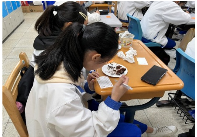
感恩祝福卡片書寫