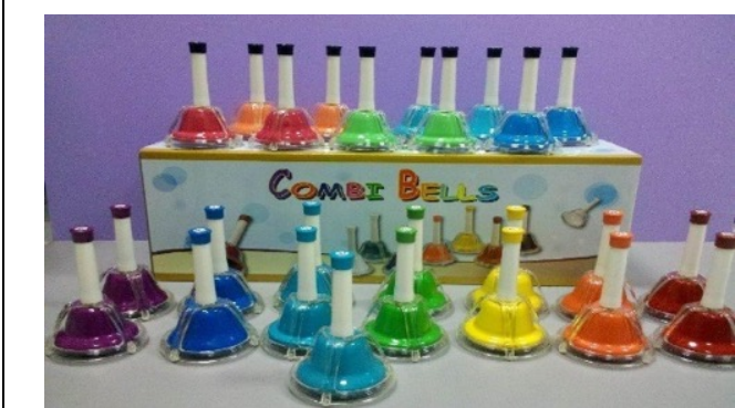
Handbell 的介紹與聖誕鈴聲緣起