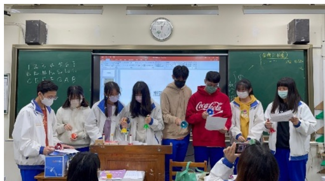
Handbell 的練習 1