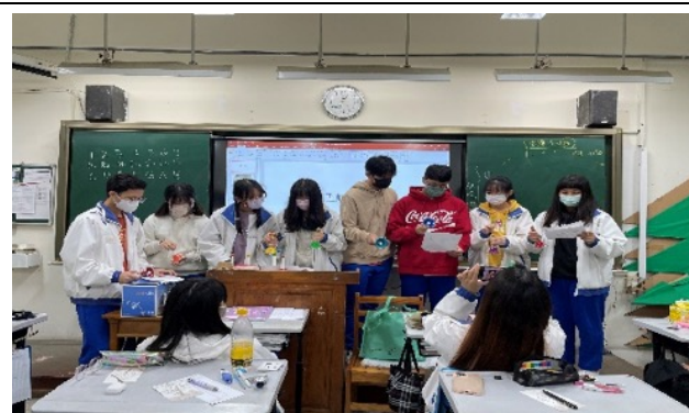
Handbell 的練習 3