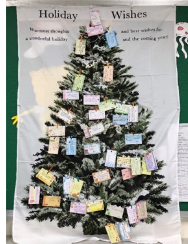
406 班級耶誕樹，充滿每個同學的祝福卡。 符合龍騰第一冊第七課的教學內容。