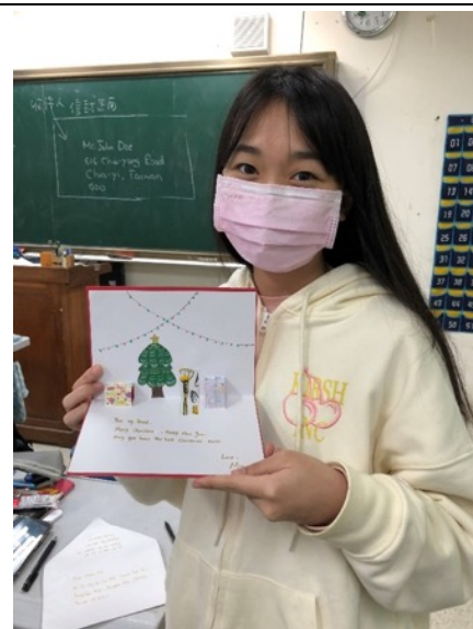
學習寫英文祝福語和如何寫英文地址