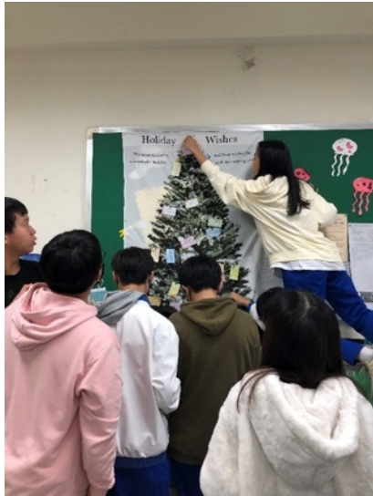
406 班級活動讓同學寫祝福卡， 以及佈置耶誕樹。