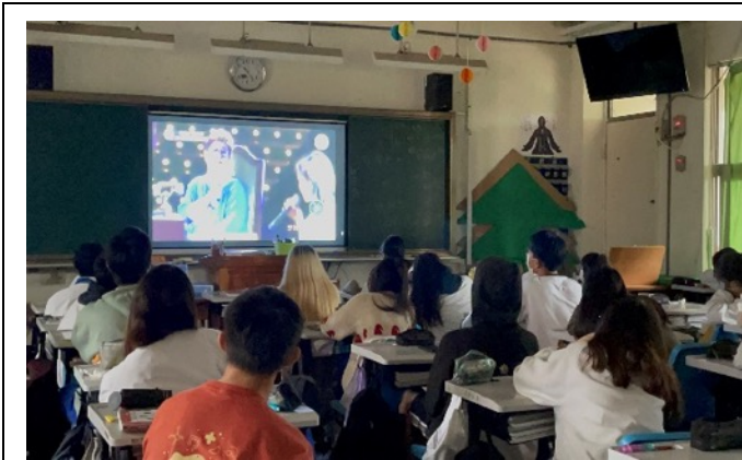
聖誕節是感恩的季節