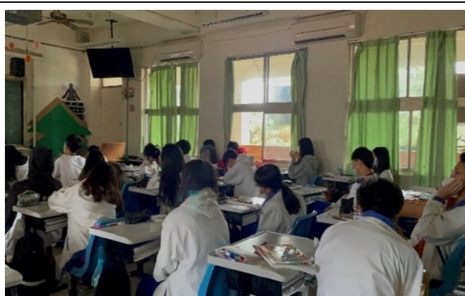
感恩情意的引導教學