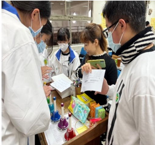
用搖鈴譜出聖誕組曲