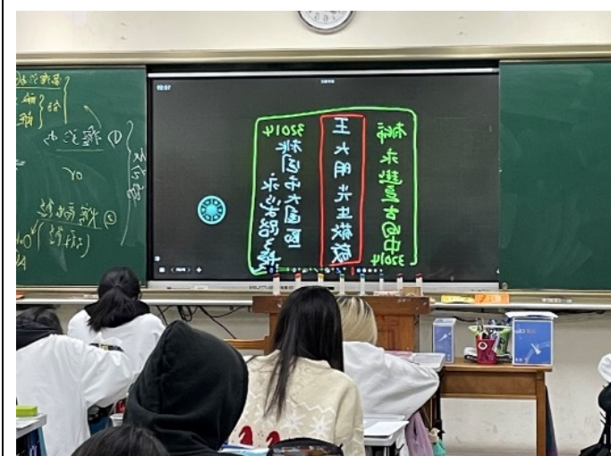
如何寫一封信跟寄信教學