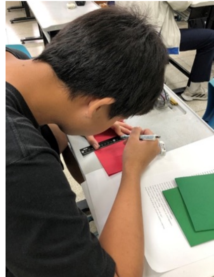
同學都很認真製作卡片