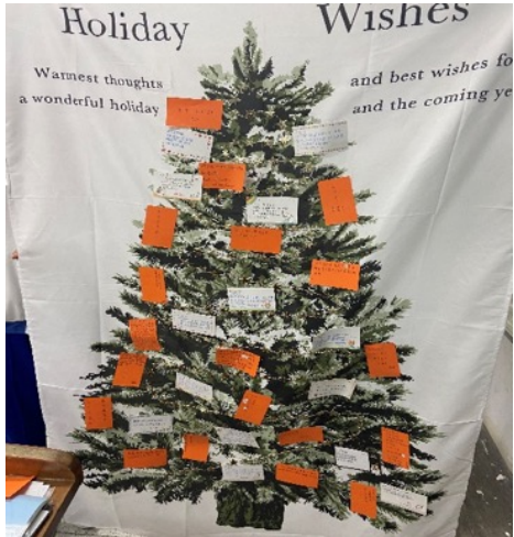
自製的聖誕樹貼上學生的感恩祝福卡片