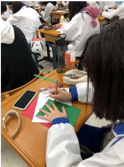
406,410,411 課堂上製作卡片 利用耶誕節三色紙紅綠白， 請學生發揮創意設計卡片和信封。