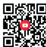
111 年會考分析與教學建議 (教育局錄製)

國中部 111 年學生績優異，會考成績 3A (達內壠高中錄取標準) 以上者達 49 人，錄取公立高中／高職／五專之學生逾總體畢業生 50%，本年度榮獲教育局全市教育會考數學、自然科之學力倍增獎表揚！