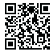
高中部畢業條件及評量辦法補充