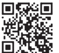
永豐高中 FB 粉絲專頁 ——永豐是個好所在

永豐高中 FB 的粉絲專頁，記錄著永豐高中邁向卓越的一點一滴，邀請家長們加入、關注，一同見證永豐高中的進步。