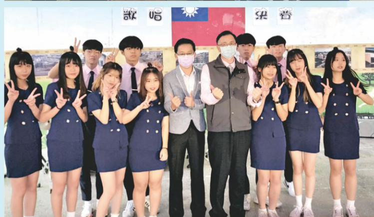
◀校長與會長蒞臨忘年會與親善大使合影