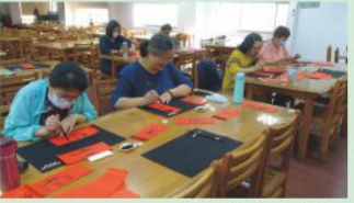
認真臨摹大師筆觸