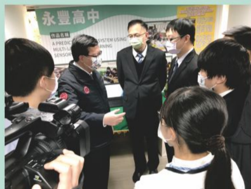
市長勉勵得獎同學