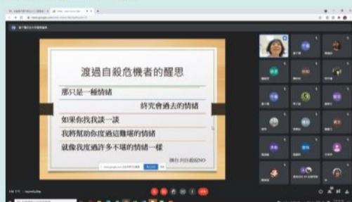
110/08/31 自殺防治教師線上增能研習

本學年辦理生命教育一校園自我傷害、自殺防治，教師增能研習及學生講座共三場，透過講座宣導，能有效推展生命教育，由專業講師提供正確策略與方法，強化師生正確情緒自我管理及求助途徑，健全身心功能，自助助人。因適逢疫情期間，教師增能研習以線上講座方式進行，透過講師分享，提升教師敏感度，早期發現高危險群同學，落實三級預防工作，有效提升情緒管理及降低自我傷害之危險情事發生。學生則於會議室進行教育宣導實體講座，講師教導學生尊重生命觀念，辨識自我情緒及提供適當紓壓管道。