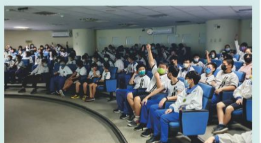
110/11/19 自殺防治講座互動熱絡