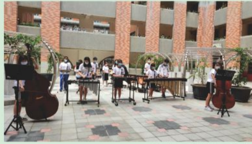
敬師同樂-吹彈歌舞

唯有多元學習的校園，才能提供學生適性、適趣的學習環境，也才有機會培養出多樣專長與多元智慧人才為社會所用。因此9月28日10:00下課時間藉由高中部熱舞社、康輔社同學所展現的熱情舞蹈、管樂社的震撼音樂演奏與流唱社唱感恩之歌，在校園中庭實施快閃表演，向本校師長們獻上最高的敬意。