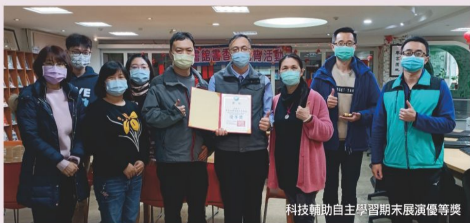
科技輔助自主學習期末展演優等獎

本校107學年度及108學年度申請通過高中職行動學習推動計畫補助，109年度參與科技輔助自主學習推動計畫，累計產出資融入教學跨領域教案超過15件，團隊榮獲108年度高中職行動學習推動計畫期末成果展演優等獎、109年高中職科技輔助自主學習期中展演優良展演獎、110年高中職科技輔助自主學習期末展演優良展演獎等榮譽。