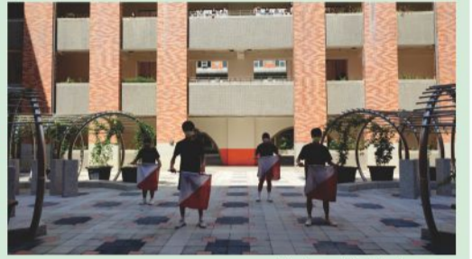
敬師同樂-旗舞飄飄