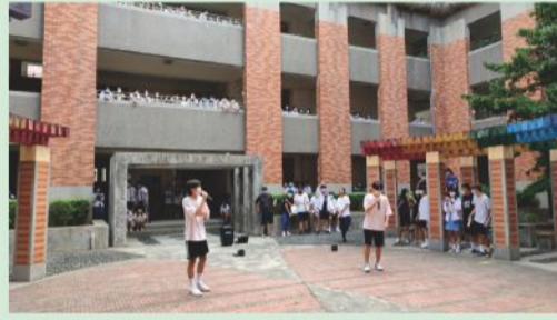
敬師同樂-歌聲繞樑