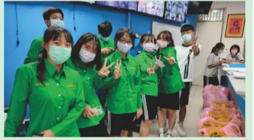
學生會代表贈花前合影