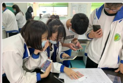
分工合作集思廣益