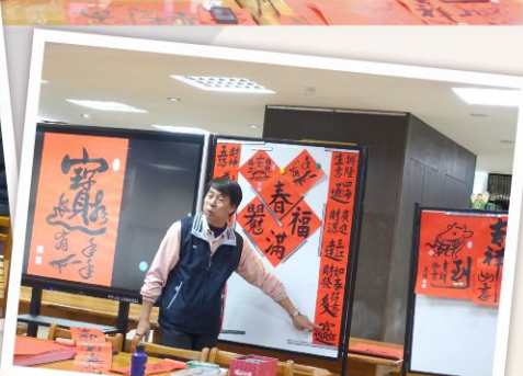
書法大師親臨教學